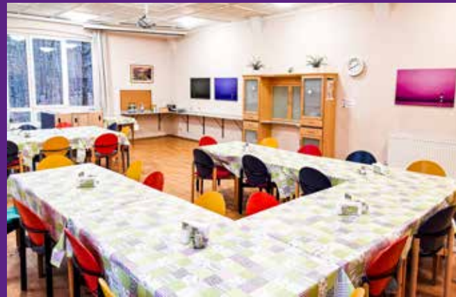
Eindrücke aus unserem Internat